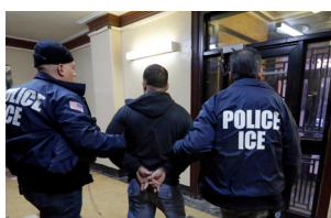
Centro de Detención